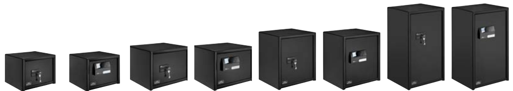
PRS 510 K PRS 510 E PRS 520 K PRS 520 E PRS 540 K PRS 540 E PRS 580 K PRS 580 E