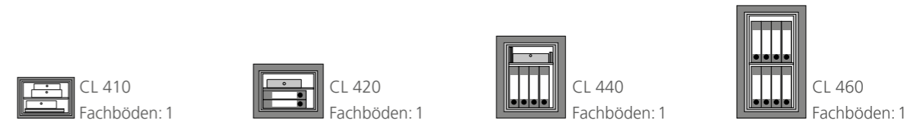
CL 410 Fachböden: 1