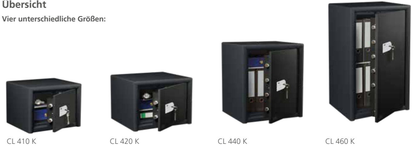
CL 410 K