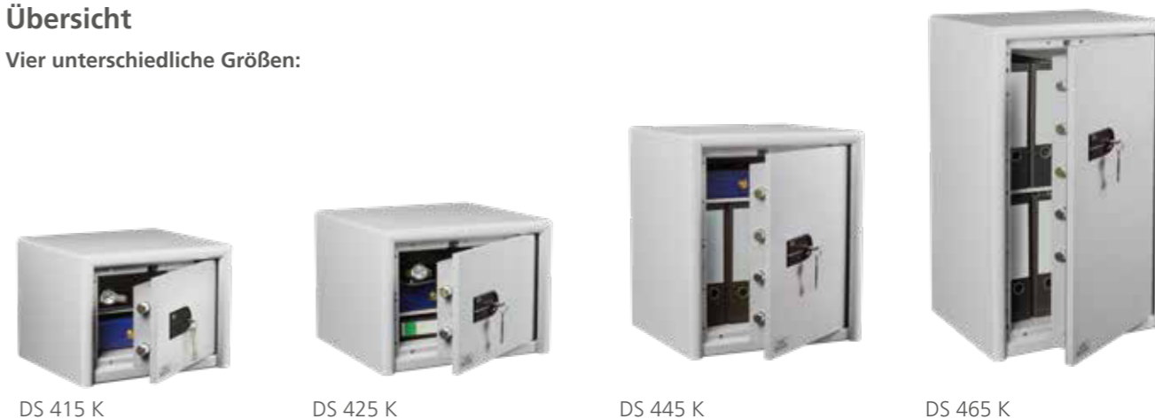
DS 415 K