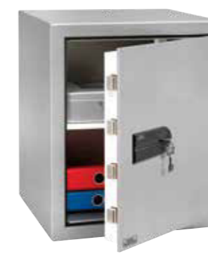
MT 660 K