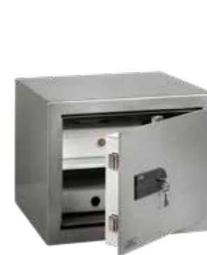
MT 640 K